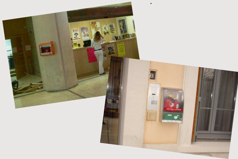
Exemples d'accès public à la défibrillation

Si rendre accessible les défibrillateurs est simple, il est néanmoins indispensable que les utilisateurs potentiels soient formés. Ainsi le programme d'accès public à la défibrillation sera très performant.